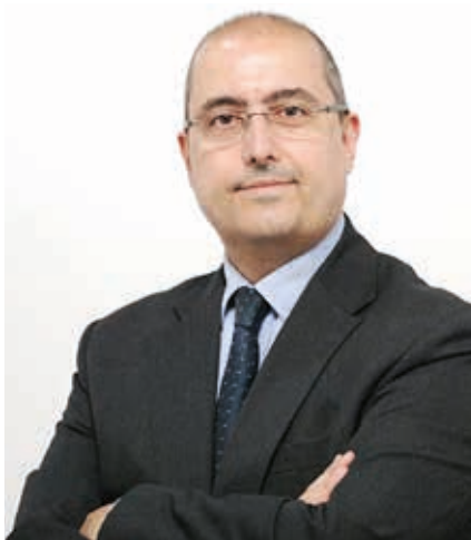
Giuseppe Buono Direttore Tecnologie e Innovazione dell'Agenzia Entrate

Sì, l'Italia è tra gli Stati membri che più si sono impegnati per favorire il passaggio alla fatturazione elettronica in Europa e, conseguentemente, l'Agenzia delle Entrate è stata coinvolta in prima linea, fin dall'inizio, per rendere operative le numerose innovazioni che hanno scandito gli ultimi due anni: dall'introduzione dell'obbligo di fatturazione elettronica verso la Pa; alla possibilità di utilizzare il Sistema di Interscambio (SdI) in uso per le fatture Pa anche per le fatture tra privati; alla messa a disposizione gratuita della procedura per generare, trasmettere e conservare le fatture elettroniche. Siamo convinti che la fatturazione elettronica Pa e, in una prospettiva sempre più ampia, B2b, rappresenti una formidabile occasione nell'ottica della digitalizzazione dei processi amministrativi. Il che, con parole più concrete, significa: risparmi considerevoli dei costi legati a carta, stampa, spedizione e archiviazione e, naturalmente, una gestione più rapida ed efficiente delle fatture, con una conseguente riduzione di errori e relativi oneri. L'e-invoicing rappresenta, non a